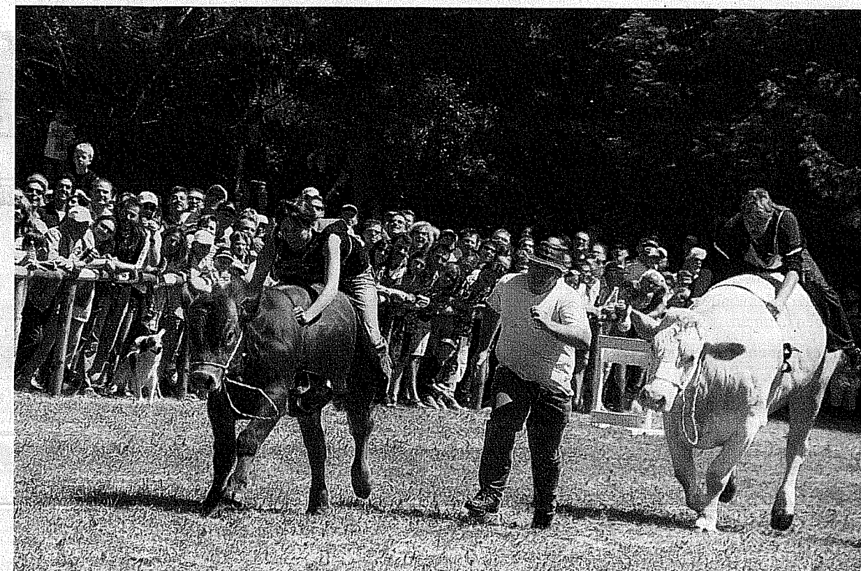
Gewaltige Muskelberge im Kurzstrecken-Sprint: Das erste Ochsenrennen beim Reit- und Fahrverein Illertissen lockte gestern 1500 Zuschauer an.

Doch der Treiber, der nebenher rennt, hat das Tier im Griff oder