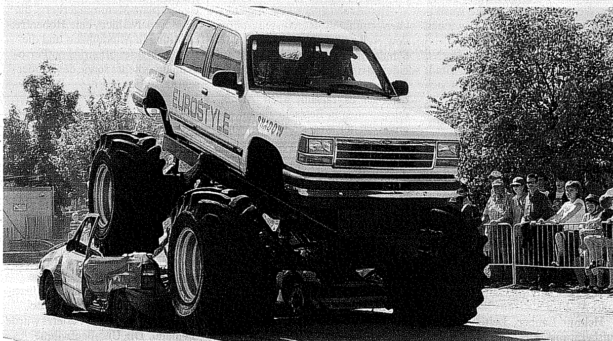
Warum außen rum, wenns auch drüber weg geht: Ein 600 PS starker „Bigfoot“-Geländewagen mit Riesenreifen macht bei der Hell-Driver Show in Illertissen zwei Altautos platt.