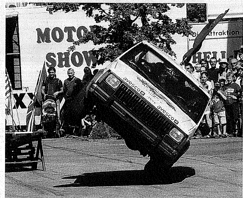
Einseitig beladen: Rene Stey zeigt die hohe Kunst des Zweirad-Fahrens mit einem Jeep und mehreren – weiblichen – Passagieren.

Höhepunkte: Hinter einem Auto wurde ein Stuntmen durchs Feuer gezogen und zwei sechs Tonnen schwere 600 PS-Ungetüme zermalmt wie Pappkartons.